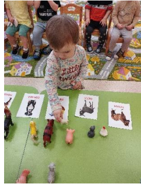
рассматривание иллюстрации про животных